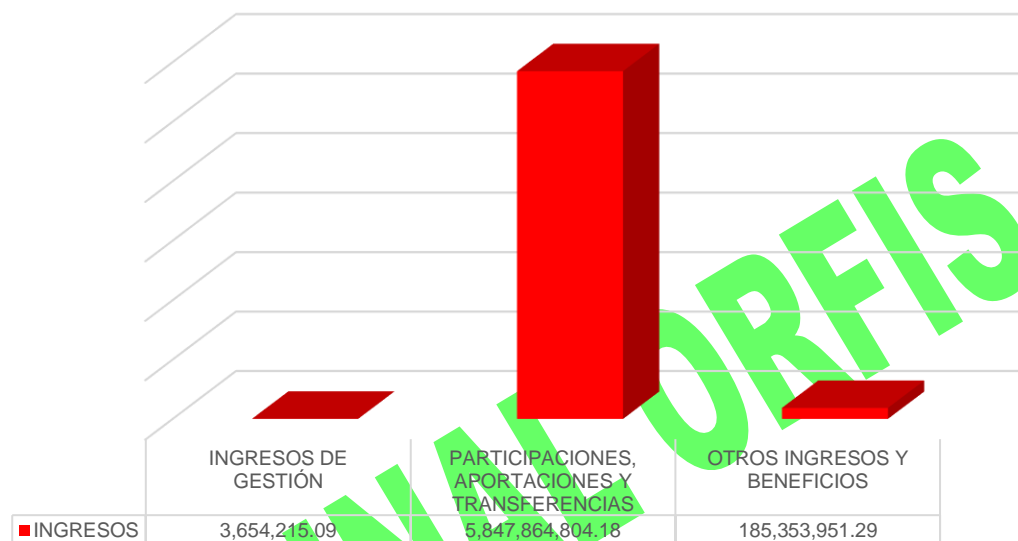
Gráfico 1. Ingresos